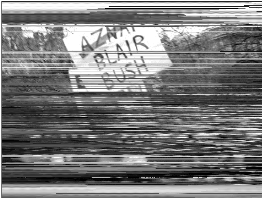
20 mars 2004. Manifestation à Londres contre la guerre et l'occu- pation en Irak